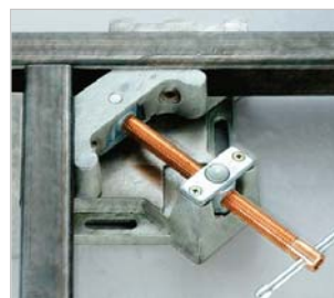
▶ Fixierung von T-Verbindungen durch offene Bauweise möglich