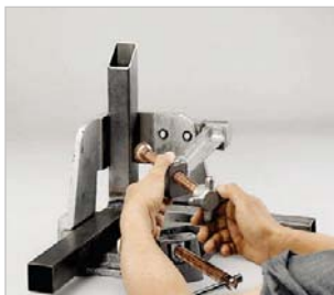
▶ mit Schnellspannung für schnelles, komfortables Einrichten (außer bei MWS-2 56)