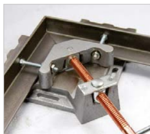
▶ mit Vorrichtung zur besseren Klemmung von Profilen