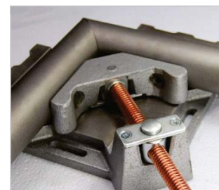
▶ auch zum Fixieren von Rundmaterial geeignet