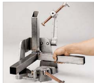
▶ der dritte Spannarm kann einfach weggedreht werden