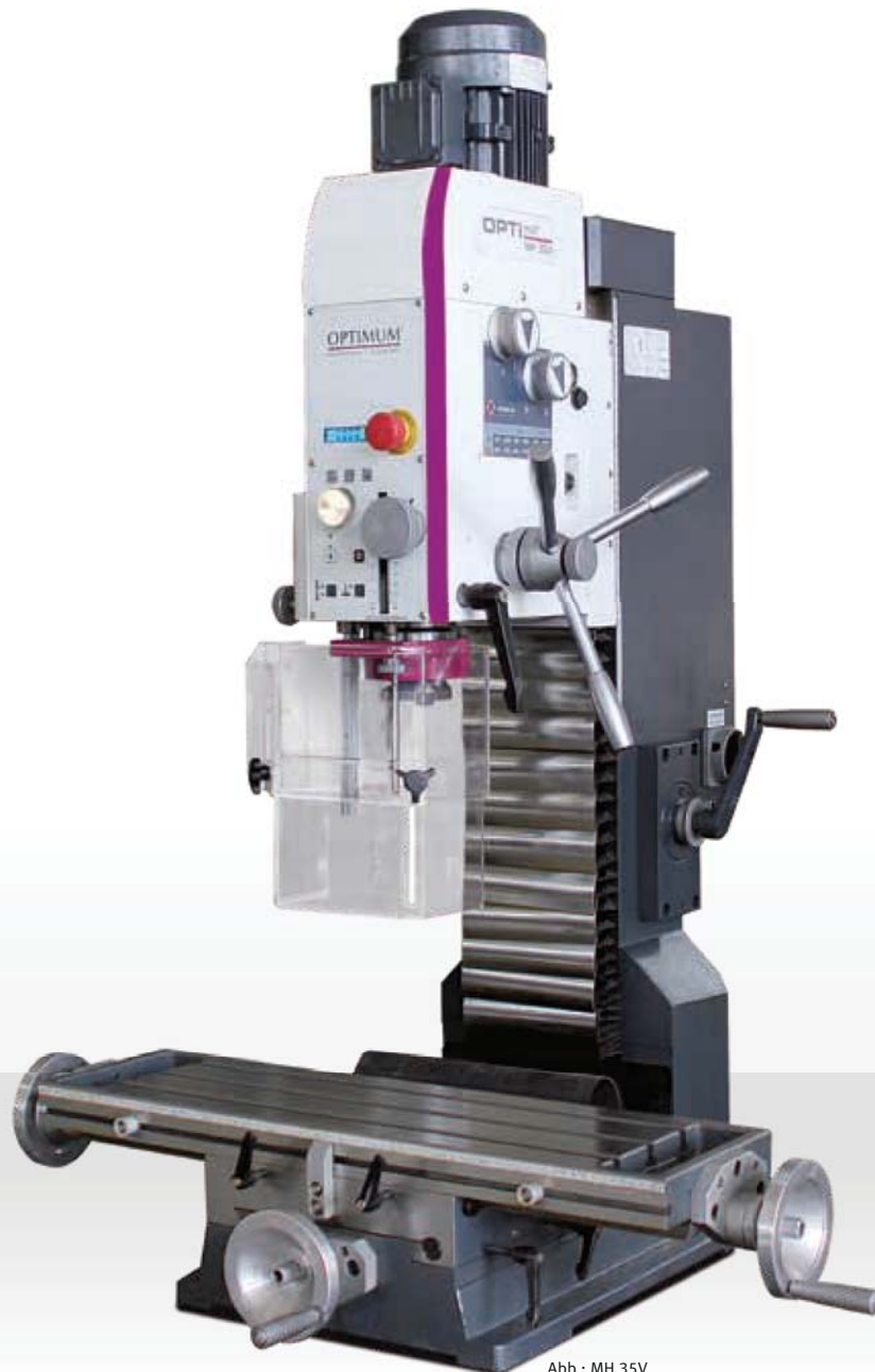
Abb.: MH 35V