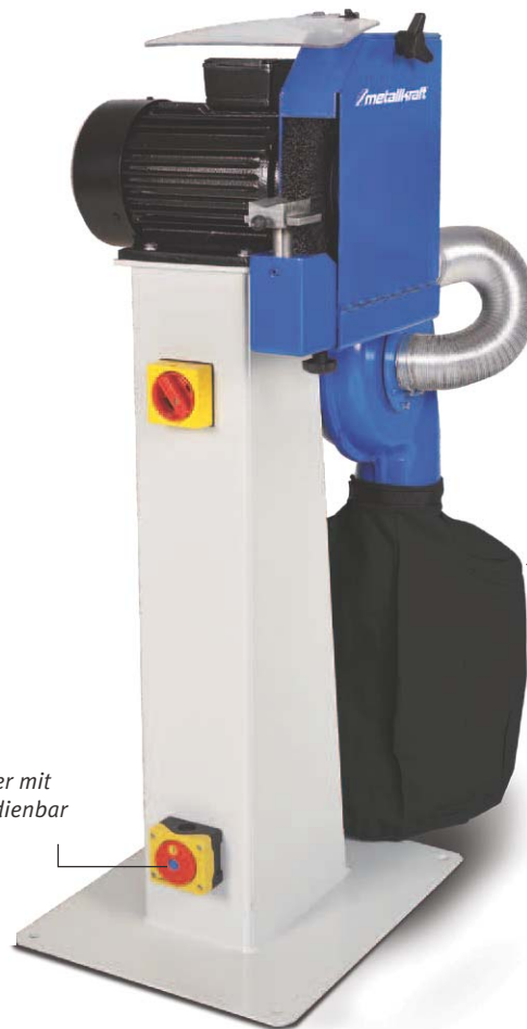
BEG 250 S