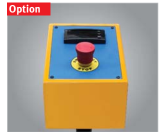
▶ Steuerpult mit Digitalanzeige der Seitenwalze