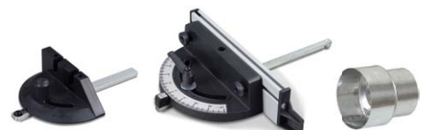
Winkelanschlag HBS 251