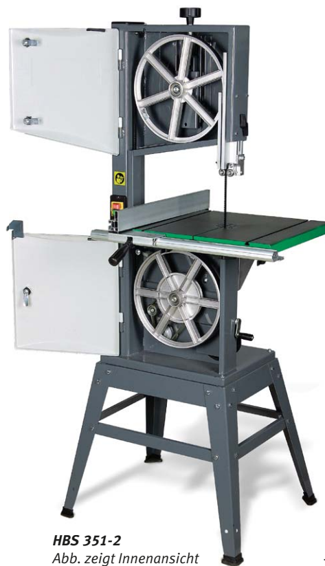
HBS 351-2 Abb. zeigt Innenansicht mit optionalem Zubehör (Unterbau)