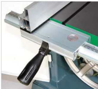
Der Aluminium-Parallelanschlag mit Exzenter-Schnellklemmung ist leicht und präzise verschiebbar. Der eingestellte Wert ist bequem über eine integrierte Lupe in Verbindung mit der Millimeterskala ablesbar.