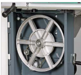
Die 2-stufige Geschwindigkeitsverstellung erfolgt manuell durch Umlegen des Riemens. Diese sind ausgestattet mit Spänebürsten für saubere Lauflächen der Antriebsräder.

Lieferumfang HBS 251 und HBS 351-2: > Ohne Winkelanschlag und ohne Unterbau