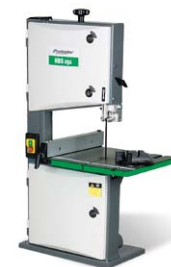
HBS 351-2 Standardausführung mit optionalem Winkelanschlag