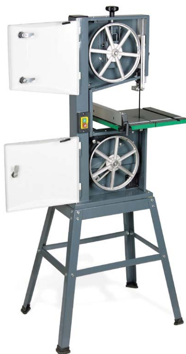
HBS 251 Abb. zeigt Innenansicht mit optionalem Zubehör (Unterbau)