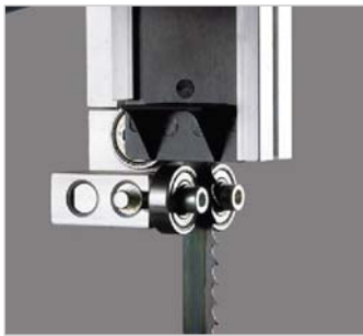
Die 3-Rollen-Sägebandführung oben und unten ist reibungsarm, präzise und leicht einstellbar.