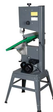
HBS 351-2 Rückansicht mit geschwenktem Säge Tisch