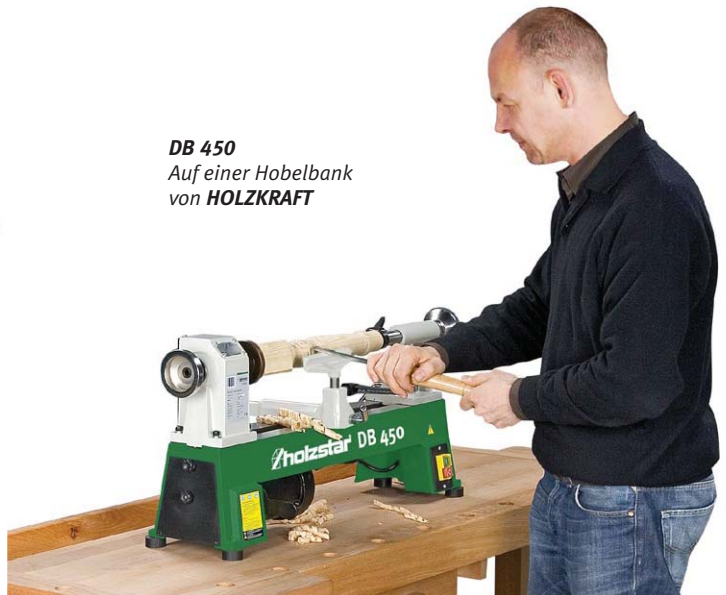
DB 450 Auf einer Hobelbank von HOLZKRAFT