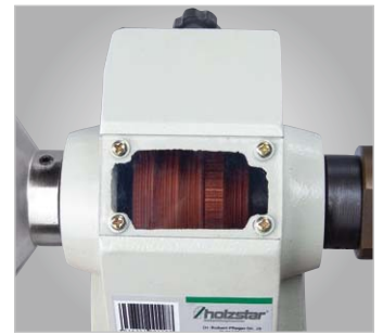
Mit Sichtfenster auf die Keilriemenscheibe zur Kontrolle der gewählten Drehzahl. Leichtes Umlegen des Keilriemens über Spannhebel.