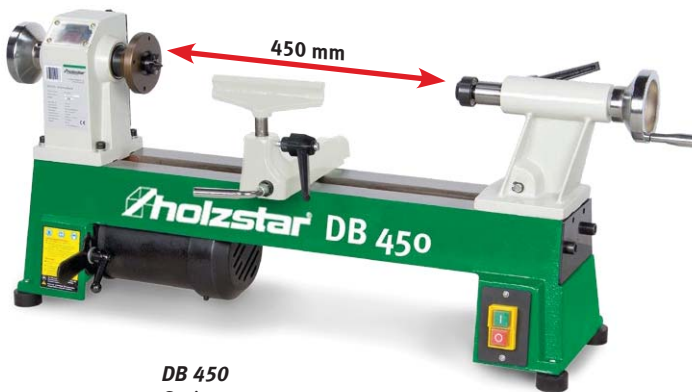
DB 450 Serienausstattung