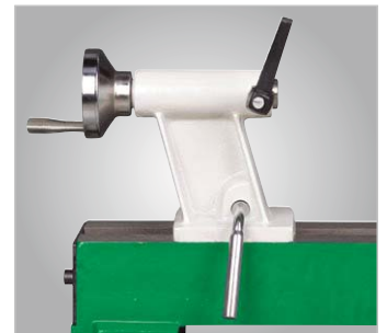
Der Reitstock aus Grauguss wird mittels Klemmhebel schnell und einfach fixiert. Die Verstellung der Pinole erfolgt über ein Handrad.