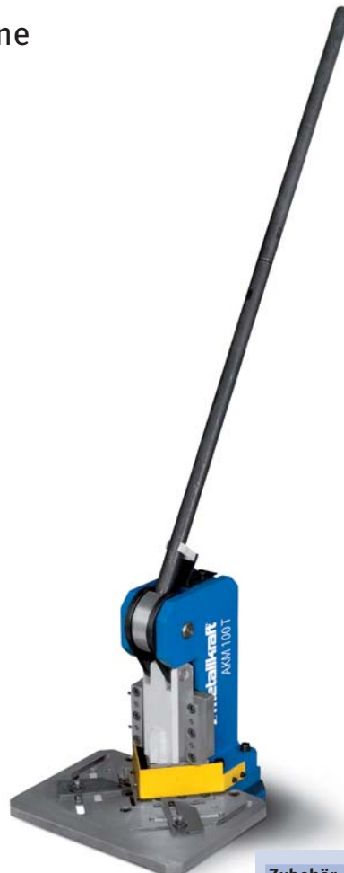
AKM 100T Manuelle Auslinkmaschine