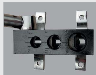
Bis zu drei verschiedene Rohrdurchmesser auslinkbar (MRA2)