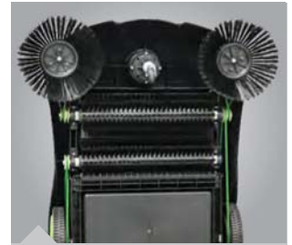
Abb. zeigt HKM 801 mit Tandem-Walzen-System