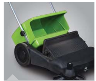
HKM 800: Großer, einfach zu entleerer Kehrgutbehälter