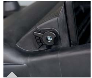
HKM 800: Einfache und werkzeuglose Höhenverstellung der Kehrwalze