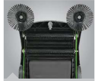
Abb. zeigt HKM 800 mit Tandem-Walzen-System